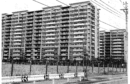
壁のようにそそり立つ、圧迫感のある建物